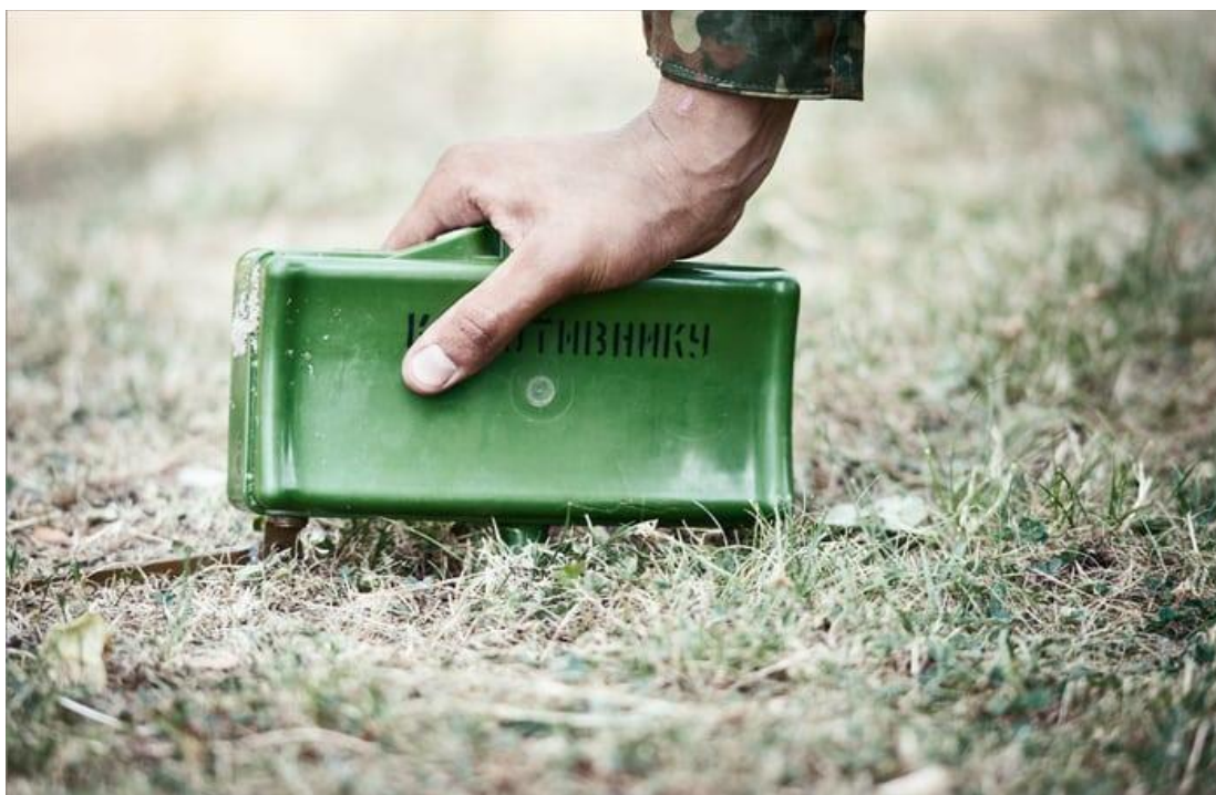
Мина в боевом положении